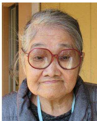
八王子市より来苑され、 月見荘に入られました。