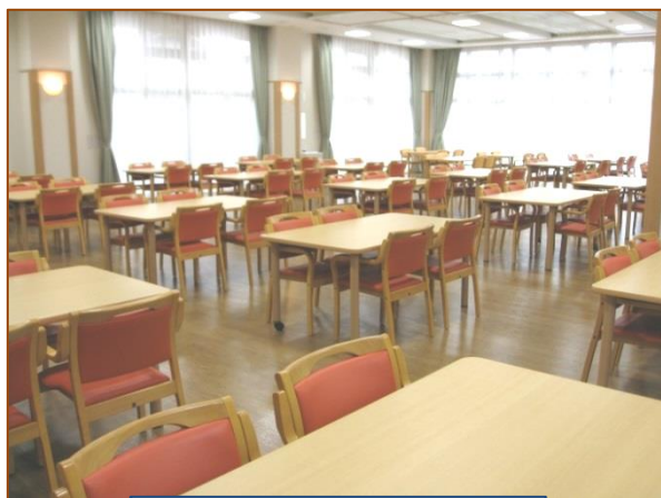
明るく開放的な食堂

申込書・同意書(1週間以上の場合には診断書)をご提出いただきます。 まずはご連絡の上、お気軽に見学、相談にご来苑ください。