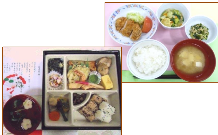
手作りの栄養バランスがとれた食事